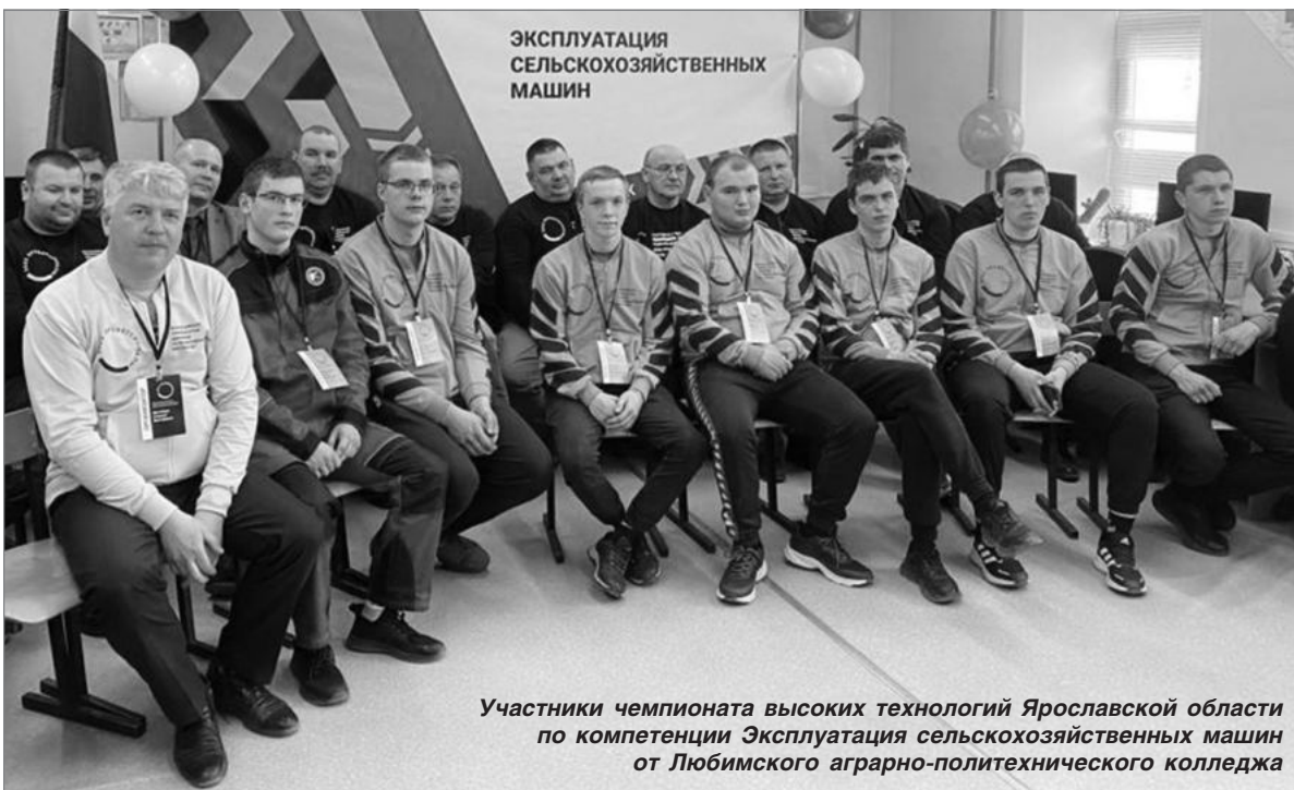
Участники чемпионата высоких технологий Ярославской области по компетенции Эксплуатация сельскохозяйственных машин от Любимского аграрно-политехнического колледжа

В Ярославской области стартовал региональный этап чемпионата по профессиональному мастерству «Профессионалы» и чемпионата высоких технологий. В течение недели, с 17 по 24 апреля, 433 студента техникумов и колледжей, а также 37 школьников продемонстрируют профессиональные компетенции.